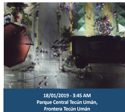
18/01/2019 - 3:45 AM Parque Central Tecún Umán, Frontera Tecún Umán