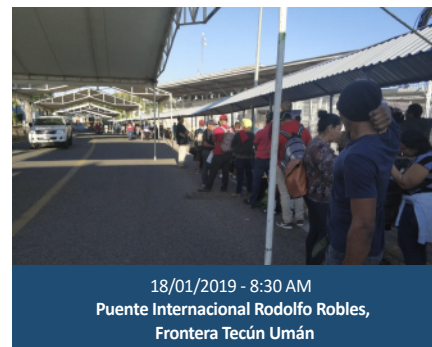
18/01/2019 - 8:30 AM Puente Internacional Rodolfo Robles, Frontera Tecún Umán