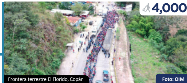
Frontera terrestre El Florido, Copán