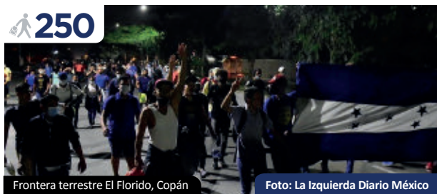
Frontera terrestre El Florido, Copán