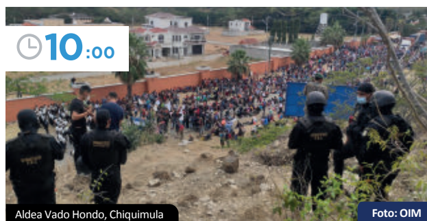
Aldea Vado Hondo, Chiquimula

El paso sigue bloqueado en el Km. 177, CA-11, Aldea Vado Hondo, Chiquimula. Se observan una fuerte presencia de agentes del orden público. Algunas personas decidieron retornar a Honduras (ver sección: Retornos).