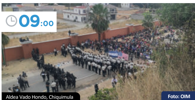
Aldea Vado Hondo, Chiquimula