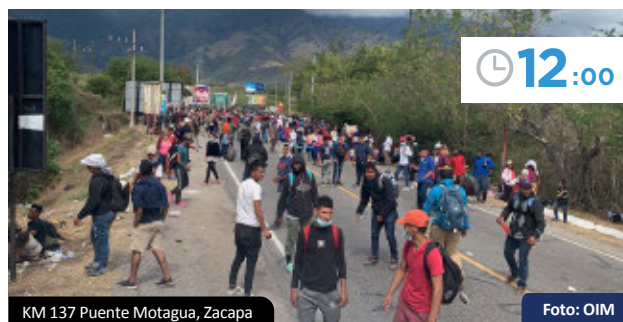
KM 137 Puente Motagua, Zacapa

Se abre paso al tráfico vehicular pesado. La situación se pone tensa entre las personas migrantes y el cuerpo de seguridad pública. La caravana retrocede hacia dirección a Frontera El Florido.