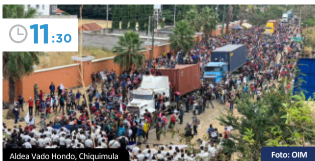
Aldea Vado Hondo, Chiquimula

La Procuraduría de Derechos Humanos, la Policía Nacional Civil y El Ejército mantienen un diálogo. Se observa que las personas migrantes levantan banderas blancas.