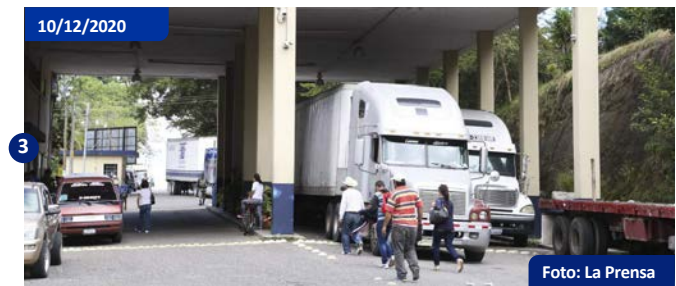
Migrantes no pueden cruzar frontera, Agua Caliente. Población no puede cruzar a Guatemala debido a requisitos en aduana y controles migratorios a pocos kilómetros de la frontera.