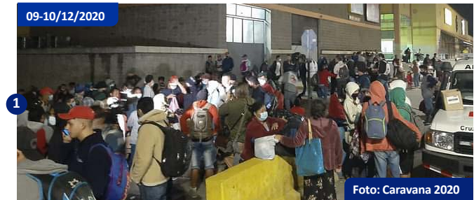
Terminal metropolitana de buses, San Pedro Sula. Punto de reunión de las personas migrantes, de donde partieron la noche del 9 y la mañana del 10 de diciembre.