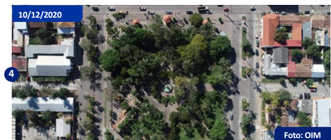
Algunos grupos se reúnen, Ocoatepeque. Debido a la dificultad en la Aduana Agua Caliente, algunos migrantes se reúnen en Ocoatepeque, a 22 kilómetros de la frontera.