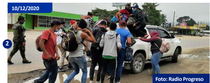
Grupos dispersos de personas, Cofradía. La población migrante, cuyo tránsito fue interrumpido por elementos de seguridad la noche anterior, se trasladó por la mañana en grupos fragmentados hacia occidente.